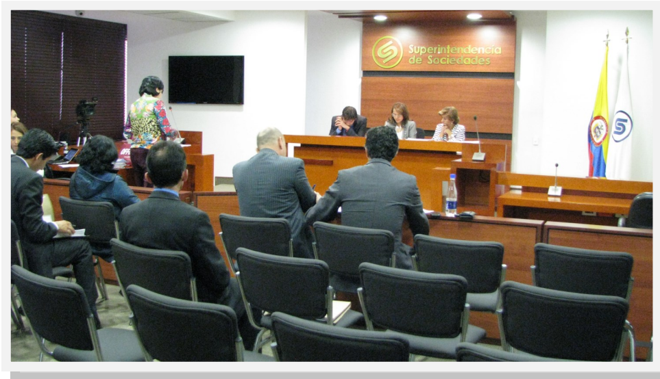
Sala de Audiencias, Supersociedades